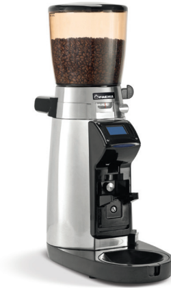
MD 3000 On demand Wireless