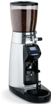
MD 3000 On demand